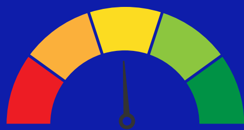
TABELA NÍVEL GRUPO II

Nesse nível, 850 moedas equivalem a 1 dólar